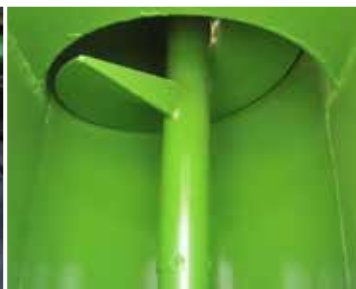
Vordere Revisionsfenster zur schnellen Prüfung der verbliebenen Materialmenge aus der Schlepperkabine heraus