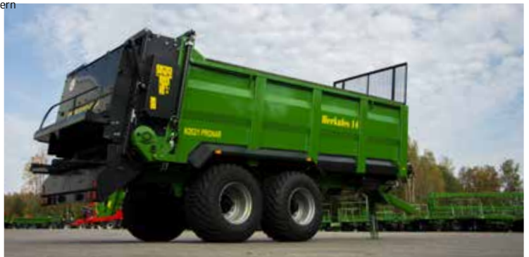
Stark und robust – die Mulde des Modells N262/1 hat eine Höhe von 1265 mm und eine Kapazität von 14 m³