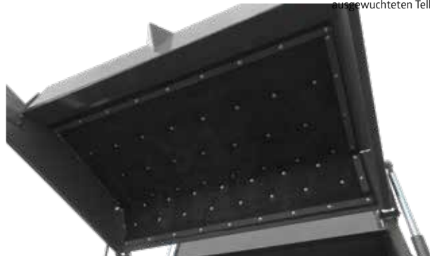
Gummiverkleidung der Innenseite der Heckklappe