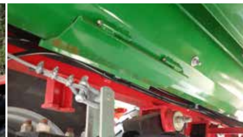
Vier Revisionsfenster am Boden (vorderes Revisionsfenster hydraulisch gesteuert) zum leichten Entfernen von Restmaterial