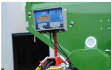
Beladungsmenge mittels elektronischem Wiegesystem präzise prüfbar (optional im T740 und T743 erhältlich)