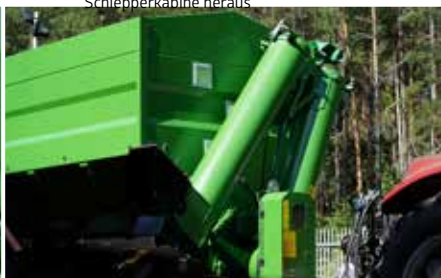
Schneckenförderertrieb mit zweistufiger Geschwindigkeitsregulierung