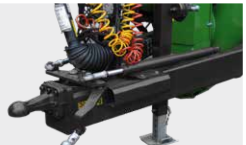
Der T743 verfügt über ein Tridem-Fahrwerk, 1. und 3. Achse sind zur Verringerung des Reifenverschleißes zwangsgelenkt