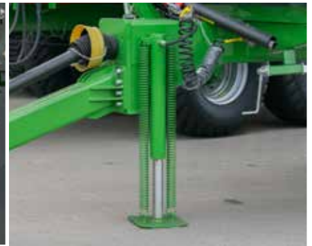
Nutzerfreundlicher, hydraulisch bedienbarer Stützfuß