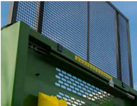
Höhenanzeiger der Rückwand

*nur bei Einzelabnahme in DE, Beratung erforderlich