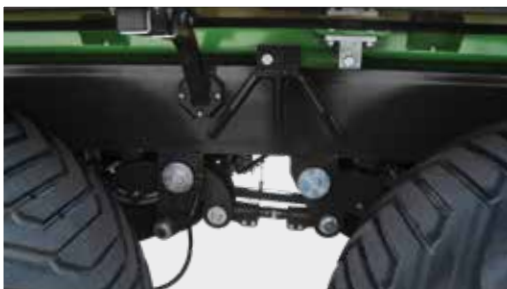
Fahrwerk des T740 mit Tandemaufhängung, Parabelfederung und Achsabstand von 1810 mm

* nur bei Einzelabnahme in DE, Beratung erforderlich