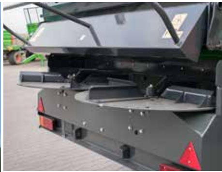
Adapter AH20 mit zwei breiten Streuern, ausgewuchteten Tellern